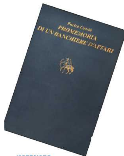
RISERVATO Enrico Cuccia , nella tipica postura durante il tragitto da casa a Mediobanca. Sopra, la copertina del libro